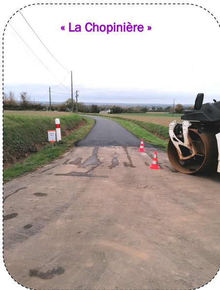
« La Chopinière »