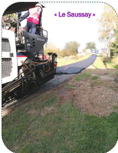
« Le Saussay »